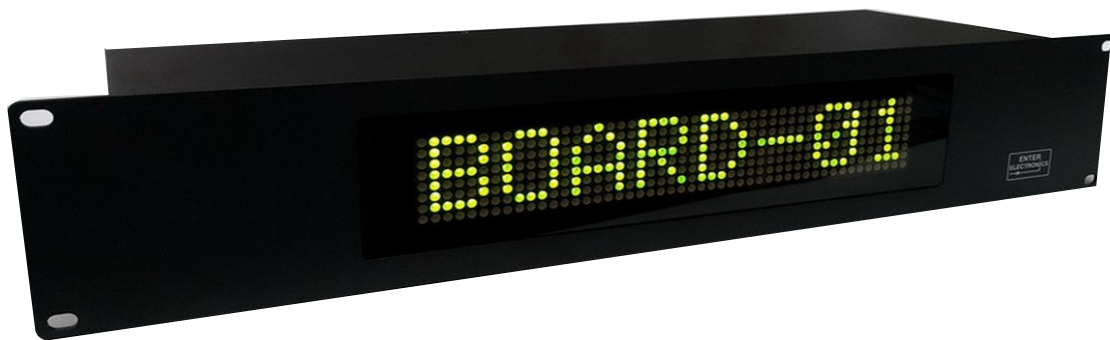
ภาพใช้งานจริง Under Monitor Display Model : UM-08 Rack 2 U